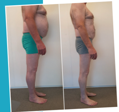
voor & na

Ik heb jarenlang echt van alles gedaan om iets aan mijn gewicht te doen en ik kreeg er niets af, totdat ik in mei 2018 van LipoMASTER hoorde. Zij hebben hun belofte meer dan waargemaakt. Beter nog: naast dat ik direct lichaamsvet verloor, was mijn doel vooral om 1 kledingmaat te verminderen en dat lukte binnen 8 behandelingen. Als ongepland bijeffect heb ik als diabetes 2-patiënt die bijna tegen insuline spuiten aanzat, nu nog maar een heel geringe dosis medicatie nodig. Mijn diabetesconsulente was heel verrast. Het lifestylecoaching-programma heeft mij veel geleerd qua mindset en keuze van voeding. Ook mijn familie, voor wie ik vaak kook, vaart er wel bij en ik blijf bestendig op gewicht, ook wanneer ik een weekend even een uitspatting gehad heb.